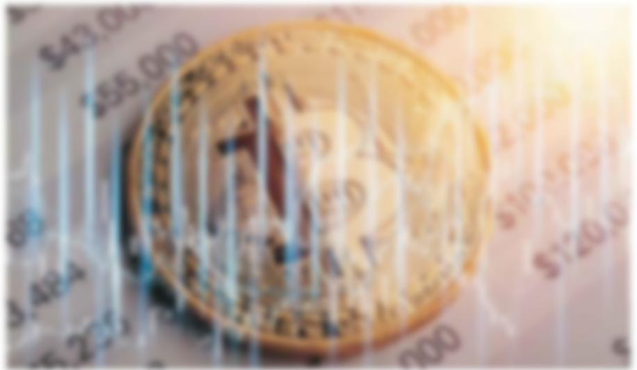
... ... ... ... ...

... plus, avec la possibilité ... travailler en déca- ... le permet à son agencement le ... ses efforts et pour être ... d'autres entreprises. Il s'agit de ... dans ce que les ap- ... offrent des « particu- ... » et ... de liquidité ». Cela se ... sur le block- ... les applications con- ... dans, l'échange de con- ... ou de avoir recours à un ... de ce type proposé par ... d'échange. Ce qui ... d'obtenir un re- ... de l'ordre de ... par an »